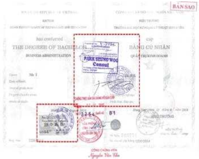
<越南学位证书大使馆认证>